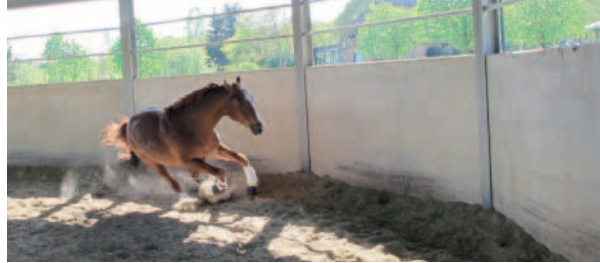
Mein „Que Lindo“ wurde mithilfe der Homöopathie von einer lebensbedrohlichen Erkrankung geheilt.

Akute Erkrankungen wie Infektionen und Entzündungen, Schock, Verletzungen aller Art, Atemwegerkran- kungen oder Erkrankungen des Verdauungsapparates können bei Verabreichung der richtigen homöopathi-